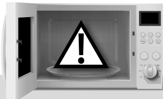
Fig. - 01

Bezoek onze website voor meer informatie: www.pingi.com